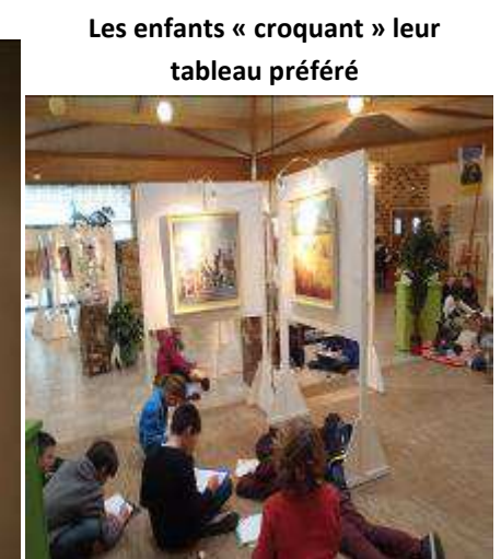
Les enfants « croquant » leur tableau préféré

Salon de la peinture et de la sculpture du 14 au 22 février 2015