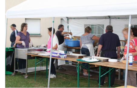
Fête communale les 13 et 14 juillet